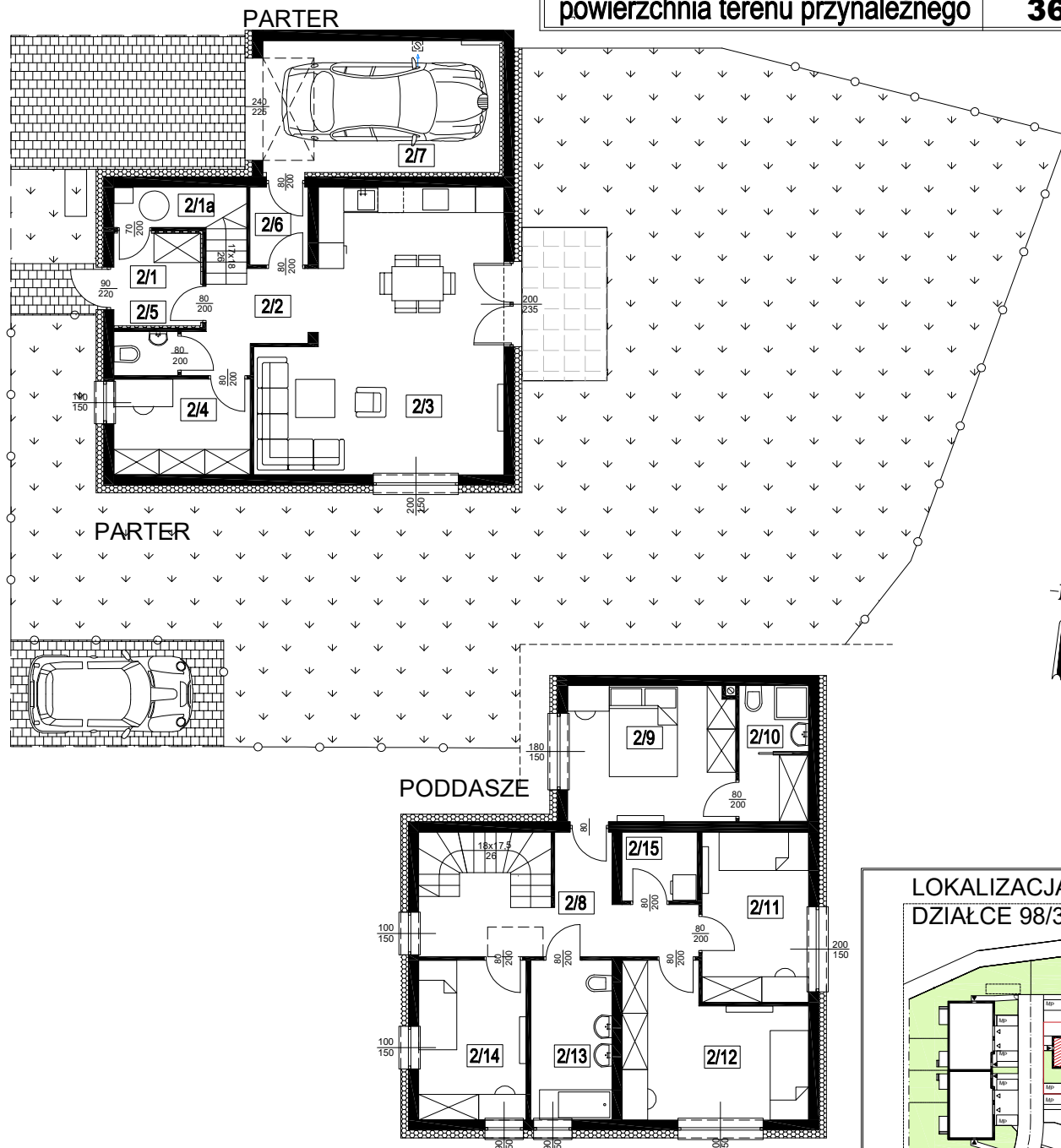
LOKALIZACJA NA DZIAŁCE 98/3