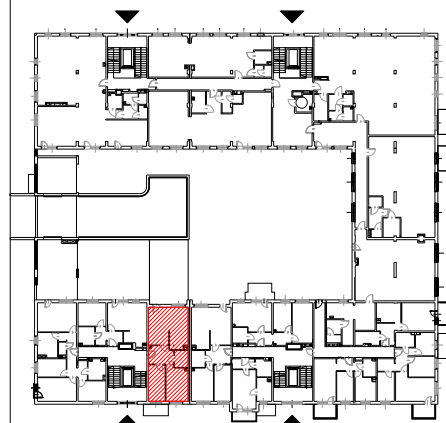
PLAN ZESPOŁU skala 1:1000